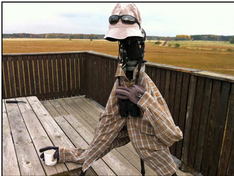
Skådarroboten SWAN 1.0