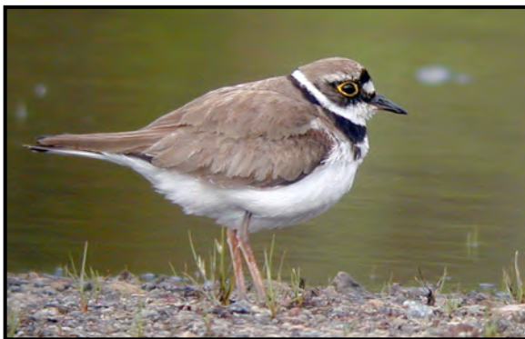
Mindre strandpipare ( Charadrius dubius ) Little Ringed Plover

Tillbaka vid Granskärs våtmark vid inventeringen 2012.