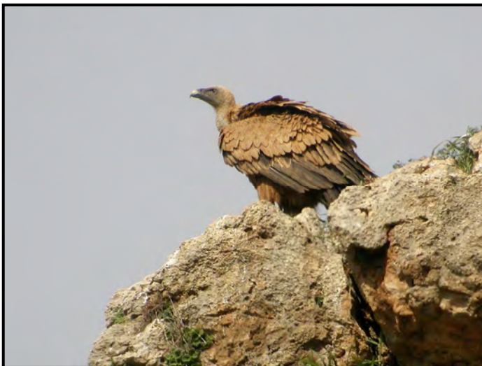
Gåsgam ( Gyps fulvus ), Spanien 2006.